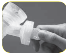
B. Twist and pull the yellow valves off the breastshields.