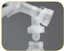
A. Remove bottles from breastshields and store breastmilk.