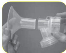
D. Separate breastshields if using the PersonalFit™ breastshields that have two pieces.