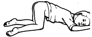
Figura 1. Niño recostado con la cara hacia abajo. Las rodillas y caderas están dobladas hacia el pecho.