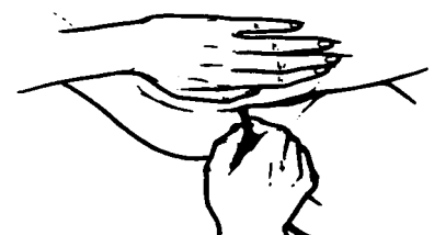
Figura 3. Inserte la punta del tubo en el recto.