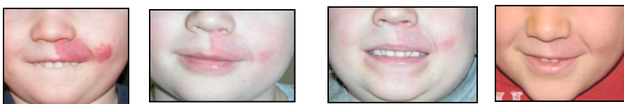
Fotos con una serie de tratamientos láser