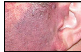
Color púrpura en un adulto